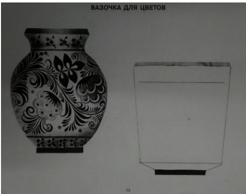
ВАЗОЧКА ДЛЯ ЦВЕТОВ